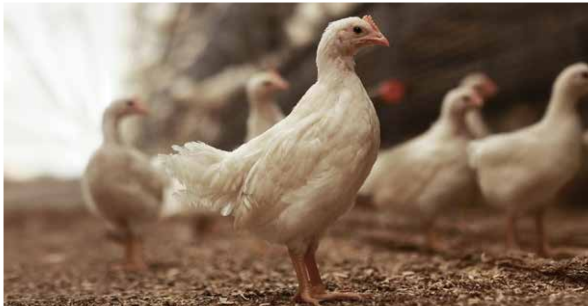
Også i oppal av verpehøns skal veterinæren registrere flere indikatorer på DVP-besøkene fra 2025.