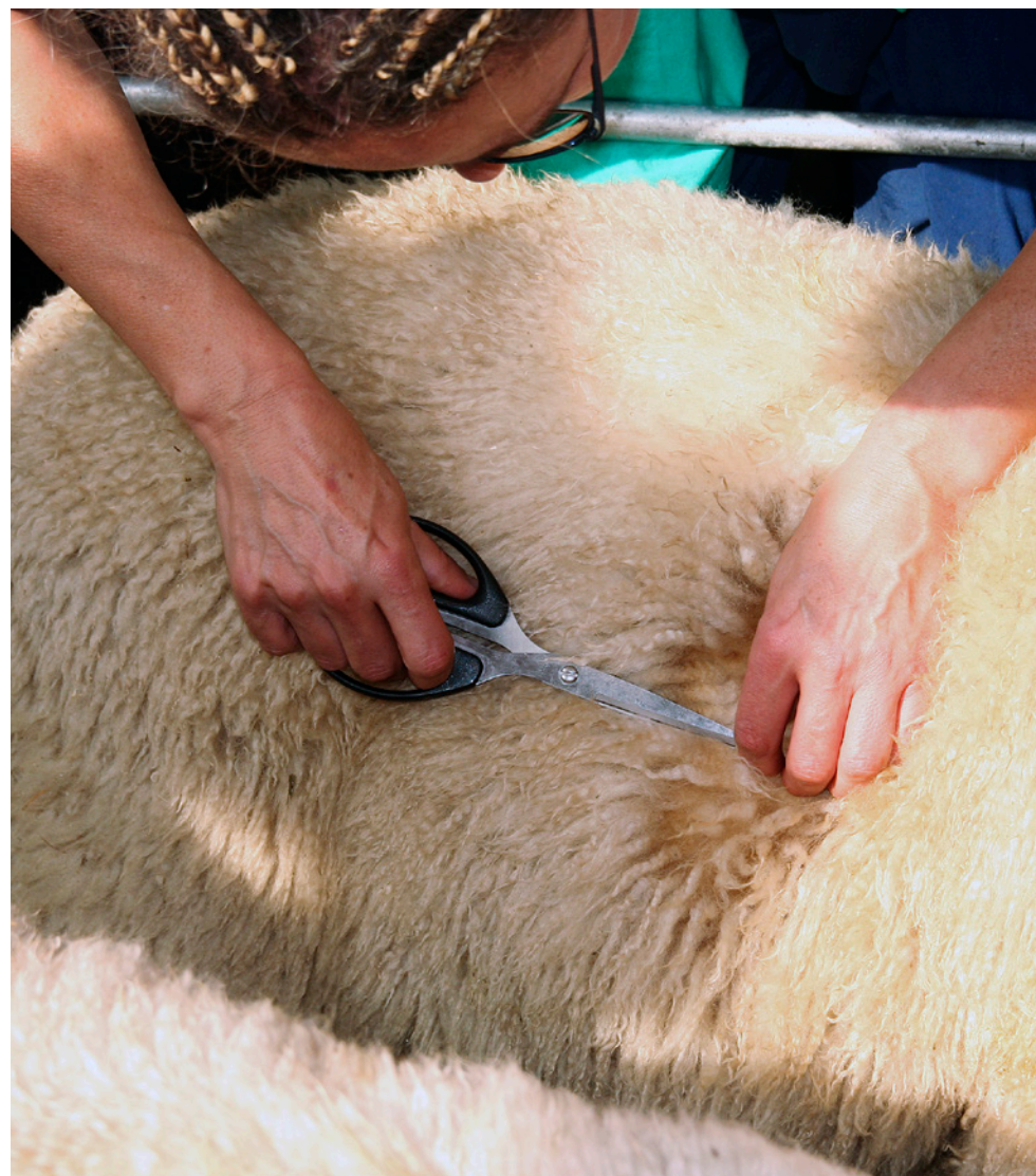
Såpass rein bør ulla vera for å kunne bedømmast korrekt. Her på verlamkåring.

Desse ullfeila skapar store problem for fabrikkane, og vi må difor gjere det vi kan for å unngå dei.