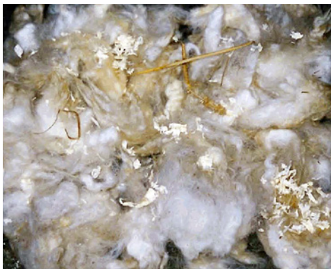
Ull med kutterflis og høy.