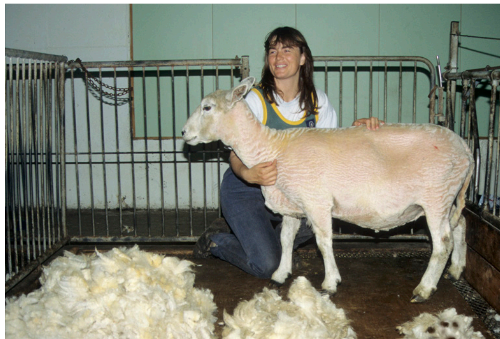
Ulla sortereres i to eller tre haugar: Fellull, fråsortert rein ull og eventuell urinbrent/sterkt tilskitna ull.

Fråsortert ull utgjer normalt 20-25% av ullmengda på dyret.