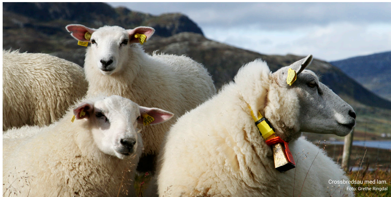
Crossbredsau med lam.

Det er grunn til å streke under at heilårsull under norske forhold alltid må klippast om