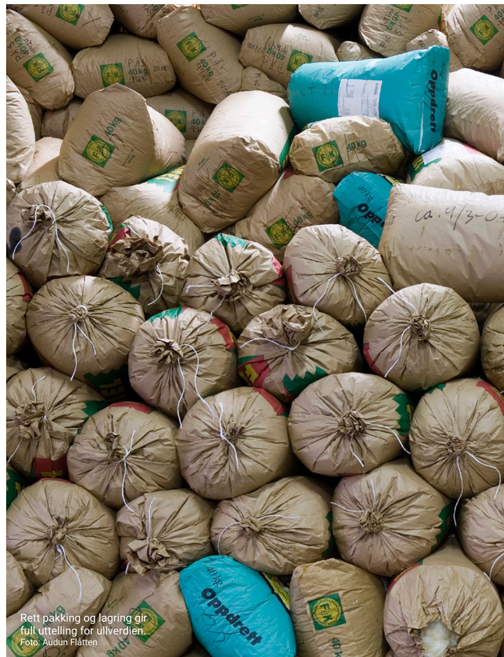
Rett pakking og lagring gir full uttelling for ullverdien.

Ullsekkene må merkast godt. Skriv namn og adresse evt. leverandørnummer for vedkommande som skal ha oppgjeret for ulla, rett på sekkene, dersom ullstasjonen ikkje har bestemt noko anna. Merkelappar kan bli borte under fraktinga. Skriv også på kvar sekk kor mange eigaren leverer. Du treng ikkje skrive på sekkene kva dei inneheld, men mange ullstasjonar set pris på å vite om sekken inneheld kvit eller farga ull, og om det er fellull eller fråsortert ull. Då vil dei velje å klasse kvit eller fargull først, og pigmentert fråsortert ull sist. Når ulla skal sendast til mottakarstasjonen, bør ein gjera det saman med andre, altså organisert i større sendingar. Dette er viktig for å spara fraktkostnader. Det er naturleg at sauallslaget på staden ordnar med innsamlinga av ulla, men det kan også gjerast av andre. Er det noko ein lurar på, bør ein ta kontakt med ullmottaket/ullstasjonen.