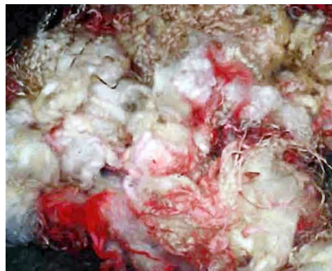
Ull med merkemåling.