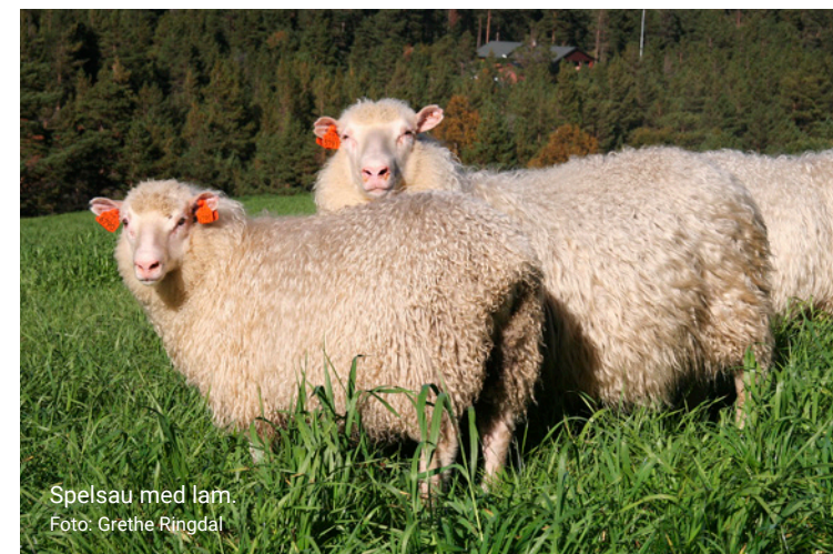
Spælsau med lam.

Ved klipping haust og vår, er det mykje lettare å halde ulla nokolunde fri for rusk og skit. Men sjølv med haust- og vårklipping må vi tenkje på ullkvaliteten når tida for klipping skal fastsetjast. Mellom anna bør ulla vera rein og ha ei brukande lengd. Omsynet til sauen som livdyr og lammeprodusent må likevel vera avgjerande for klippetida. Slike omsyn treng ikkje gå ut over ullkvaliteten.