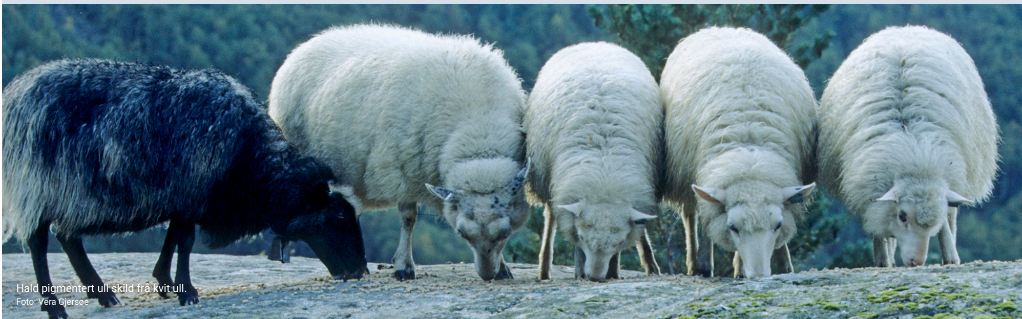
Hald pigmentert ull skild frå kvit ull.