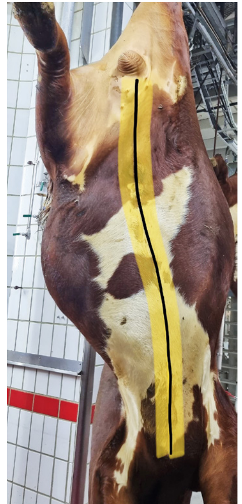
Snittlinje fra brystbue til pung/jur og 10 cm ut fra denne linjen.

Den bedømmingen som gjøres på slakteriet har betydning både for slakteriet og produsenten. Det er derfor viktig at den gjøres riktig og på lik måte av alle operatører i alle slakterier.