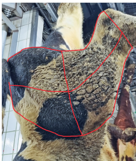
Lår hvor hvert område utgjør ca 25%.