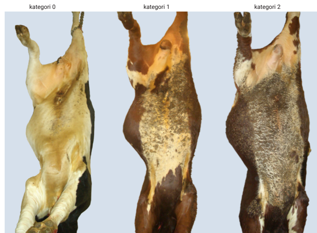
Bildene viser typiske dyr i kategoriene og angir ikke grensene mellom dem