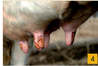
Foto: Evert van Leeuwen og Roger Vrouwenraets. Fra brosjyren «Beredskap Blåtunge»