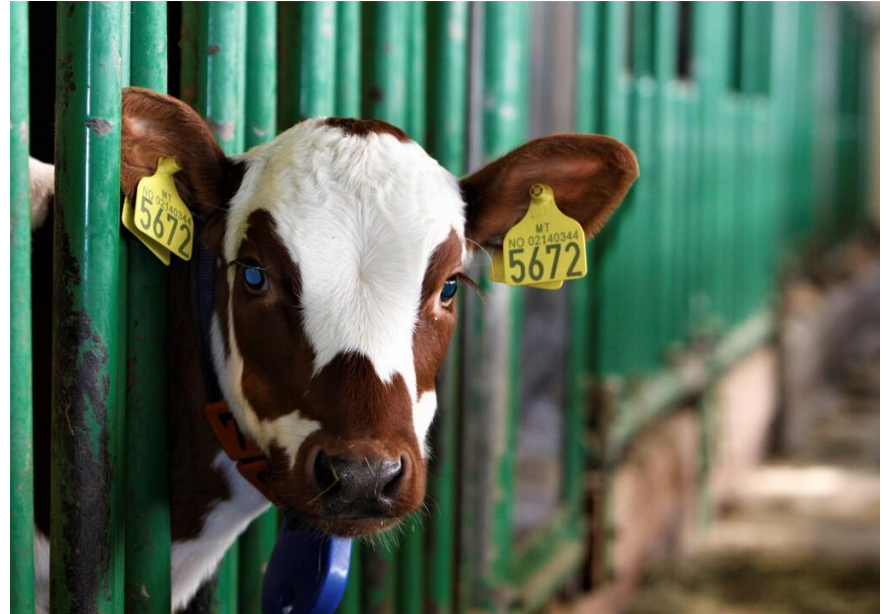
Illustrasjonsfoto: Hold dyr innendørs om natta for å redusere smitterisikoen.