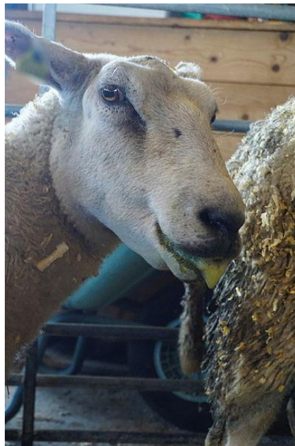
Sau med symptomer på blåtunge. Bildene viser sau fra en gård i Kristiansand og er tatt 11. september 2024.