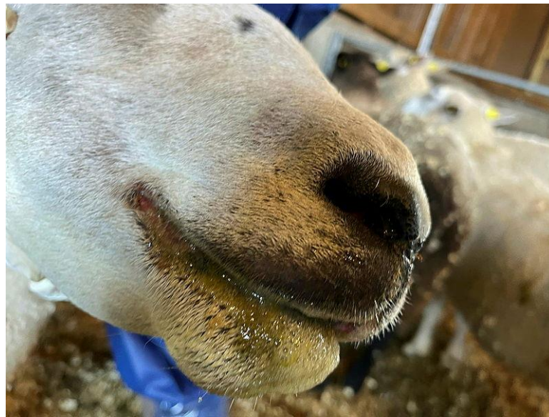
Sau med symptomer på blåtunge og som sikler. Bildet er tatt av sau på en gård i Agder i september 2024.