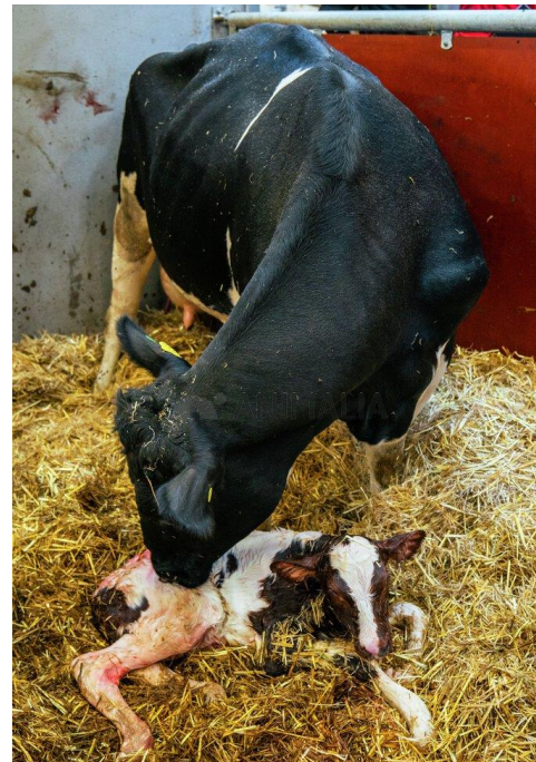
Illustrasjonsfoto: vertikal smitte.