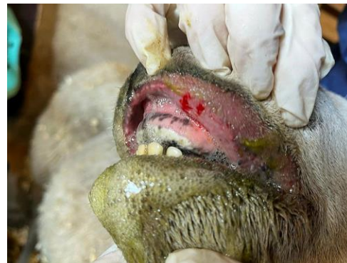
Sau med symptomer på blåtunge og blødning og skum fra munn. Bildet er tatt av sau på en bondegård i Agder i september 2024.