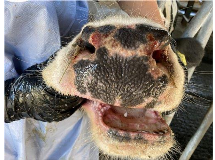
Sår på nese og rennende nese.