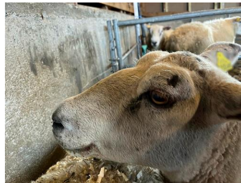
Sau med symptomer på blåtunge og hovent ansikt. Bildet er tatt av sau på en bondegård i Agder i september 2024.